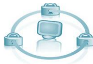
Gestión de Bloqueos