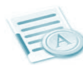
Avisos y Delegaciones