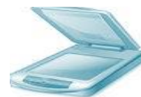
Centro de Digitalización